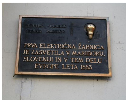
Slika 1: Fotografiji z Grajskega trga v Mariboru, kjer je zasvetila prva električna svetilka v Sloveniji.