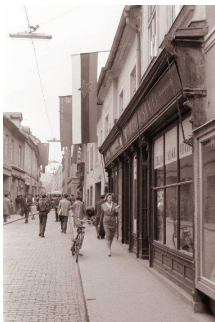
Slika 2: Fotografije z utrinki iz zgodovine mesta Maribora z vidnimi svetilkami javne razsvetljave, značilne za določeno obdobje.